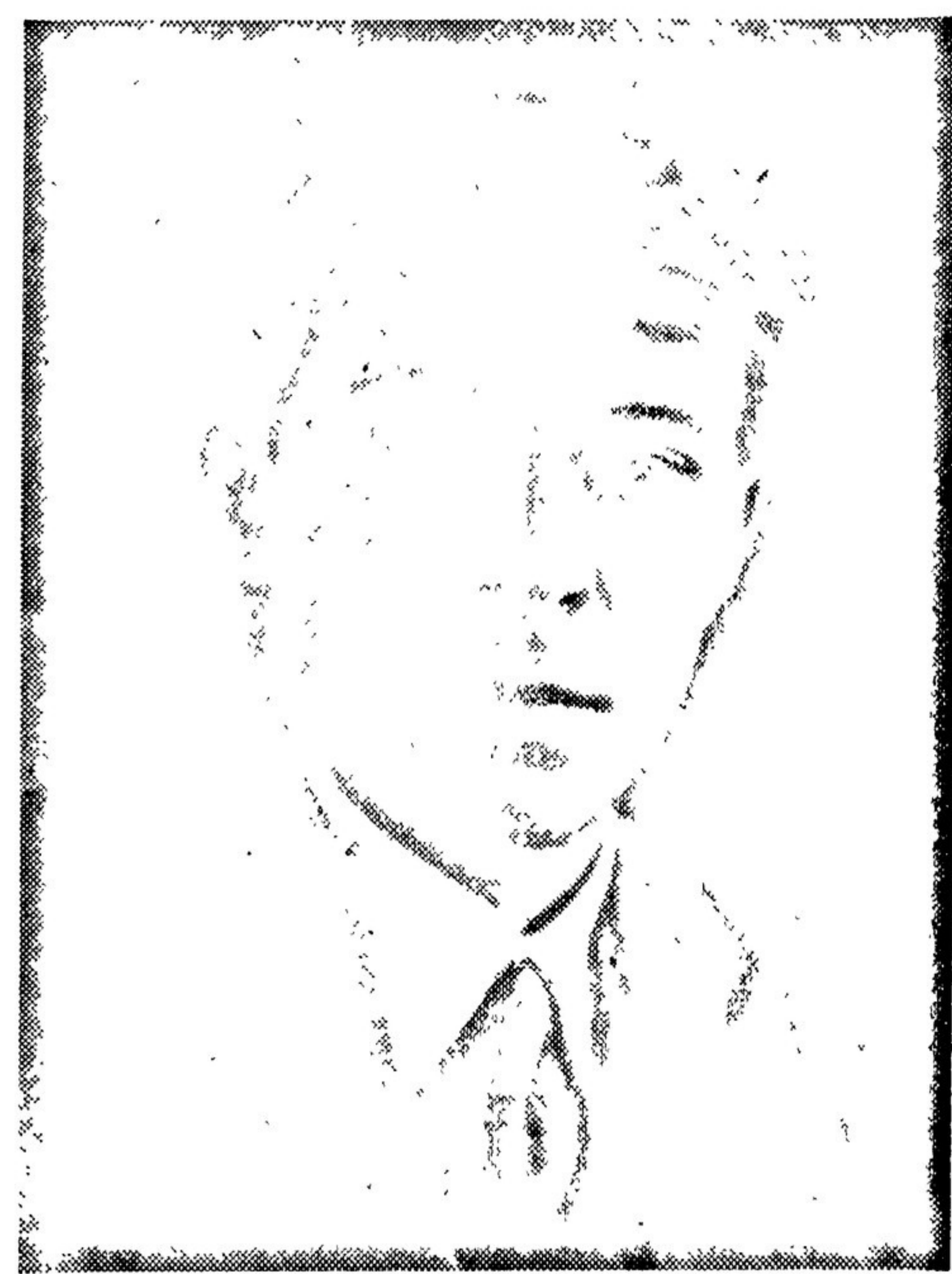
Секретарь ЦК ВЛКСМ Т. А. Косарев

Наша молодежь куда продолжительнее, чем где бы то ни было на свете. Но все же из песни слова не выкинешь, — и мы, люди, пережившие за 30 и 40 лет, с особенным чувством приветствуем съезд комсомольского поколения и от всего сердца ждем рутью подлетевшего поколения, которое пришло в мир позже нас, но с которым у нас общая цель, общая работа во имя всеобщего счастья.