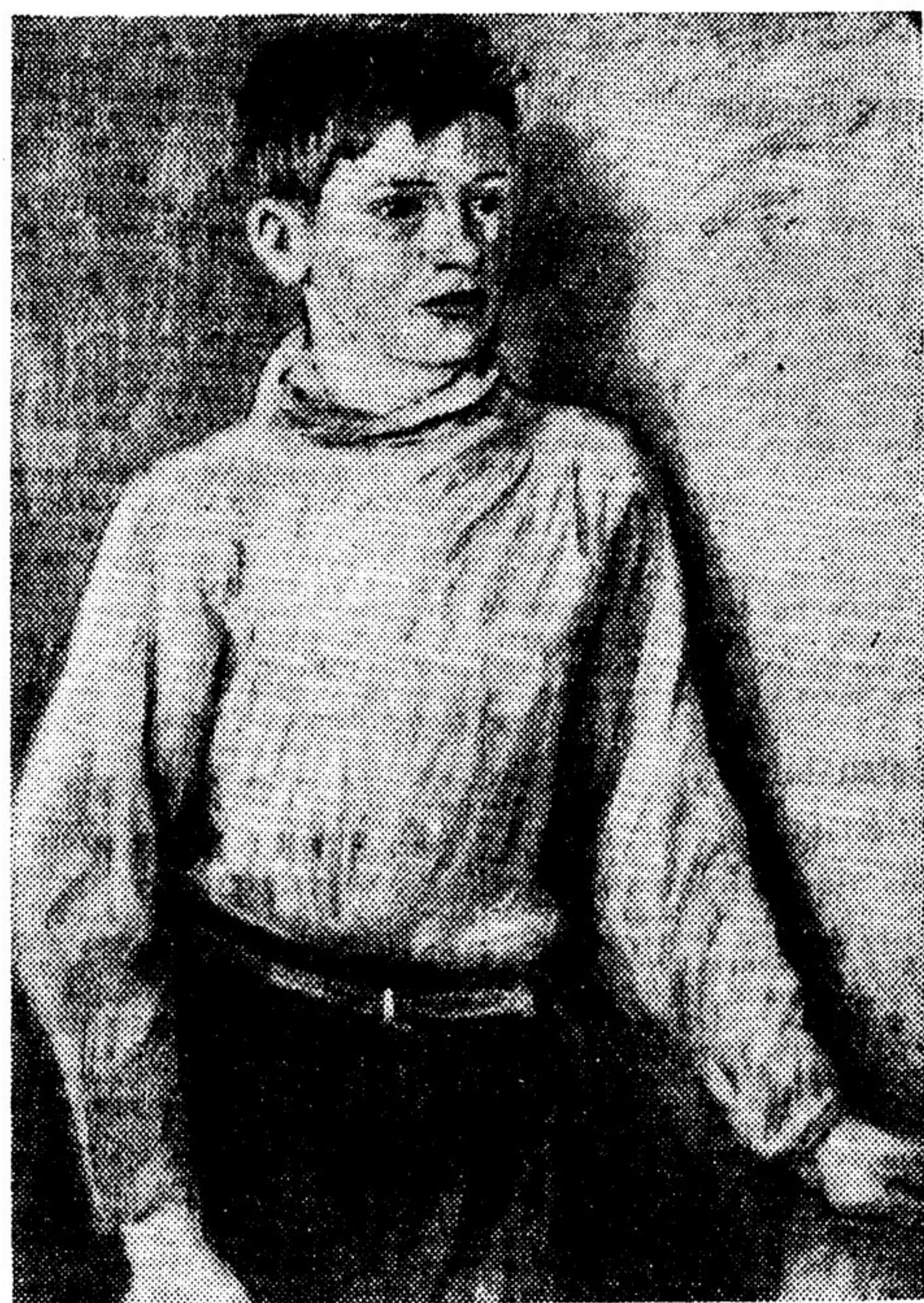
М. Л. Пастернак. «Портрет мальчишки».