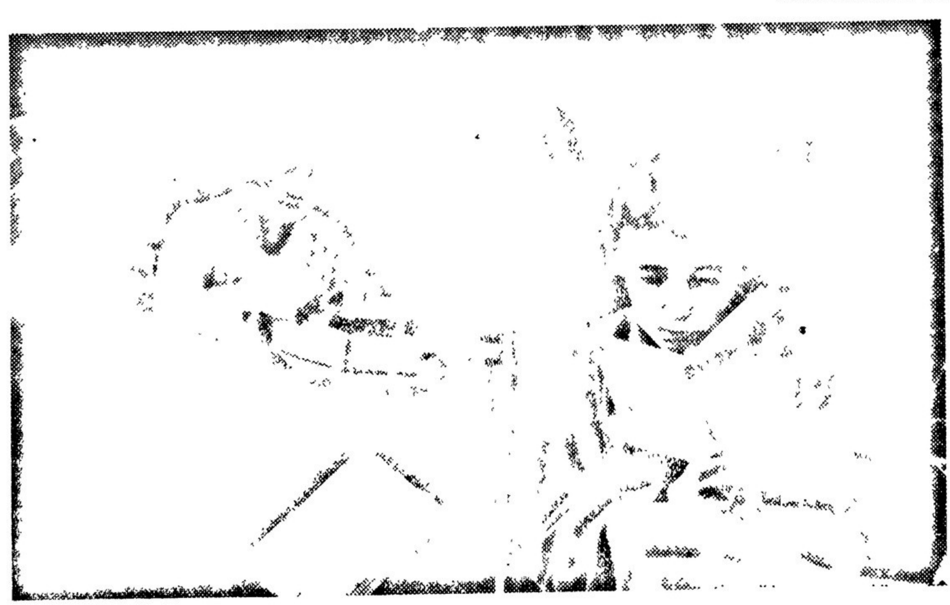
В подарок X съезду комсомола Бауманский район комсомола открыл районный Дом пионеров и октябрят на Спартаковской площади, 9. В день открытия съезда 12 апреля Дом пионеров устраивает встречу с делегатами съезда, которым будут переданы подарки ребят. Пионеры и октябрята Бауманского района приготовили список 6.000 подарков, из которых 120 отобрано для выставкам, организуемой в Кресты. НА СНИМКЕ: пионеры в своей читальне.